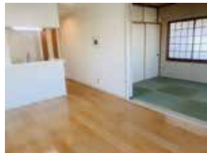
▲Living Dining & Japaneseroom